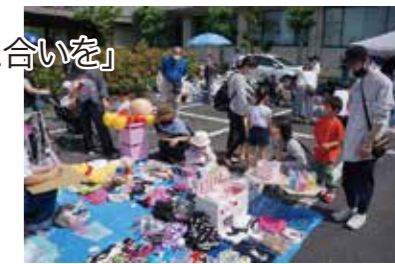
子供用品限定フリーマーケット