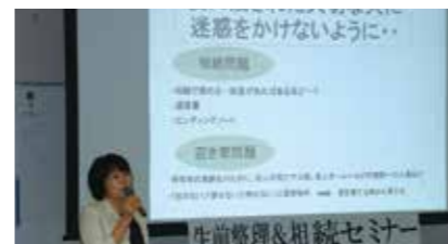
生前整理&相続セミナー