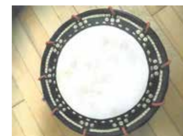
締太鼓両面張替 (郷司給浮立保存会)

「地区祭り」「伝承芸能」についての補助は、最大80,000円とし、補助率も最大80%です。補助を受けた年を含めた以後5年間は、補助対象外になります。