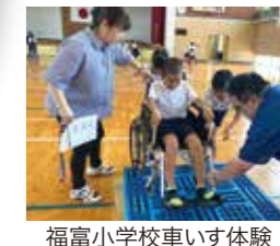
福富小学校車いす体験