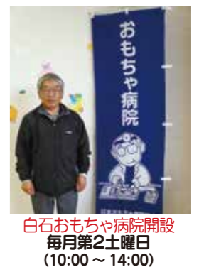
白石おもちゃ病院開設 毎月第2土曜日 (10:00~14:00)