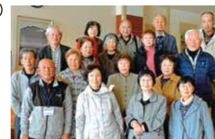
みんなで佐賀新聞社を見学! (社協車両支援:中郷サロン元気塾)