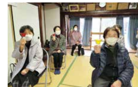
ハンドベルの音色が心に響きます (上甘治サロン)