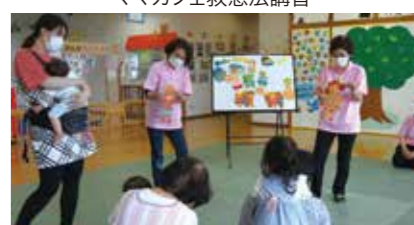
ありあけお話しキャラバン