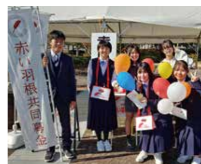
有明中学校募金活動