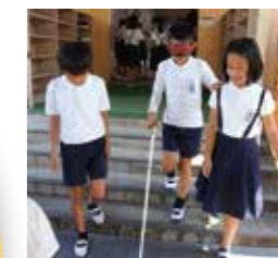
白石小学校アイマスク体験