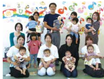
ママカフェ救急法講習