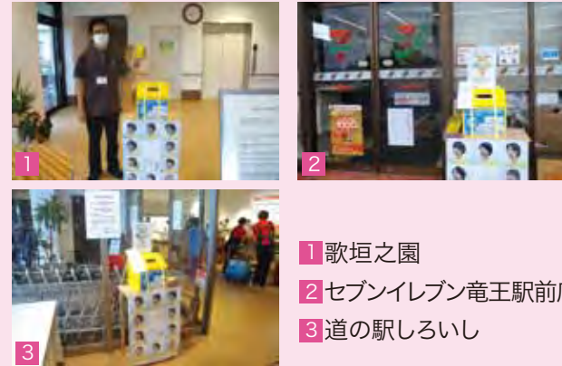
1 歌垣之園 2 セブンイレブン竜王駅前店 3 道の駅しろいし

「歌垣之園」「蓮花の会」のご協力もいただき、 総額86,644円 の募金が集まりました。町民の皆様、誠にありがとうございました。