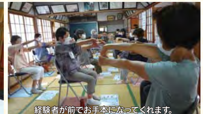
経験者が前でお手本になってくれます。