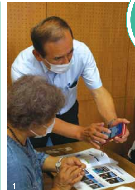
写真1…「これば、こうすると…」「あら〜っ!」