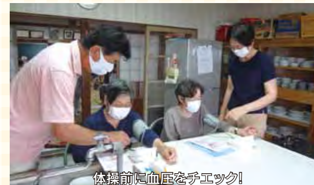
体操前に血圧を手エック!