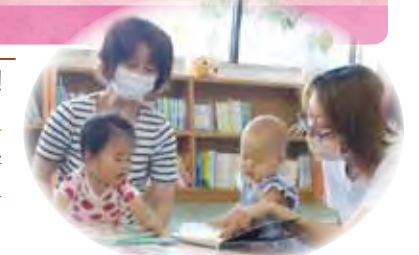
7月20日の「読み聞かせの日」 親子で絵本や紙芝居を楽しみました。