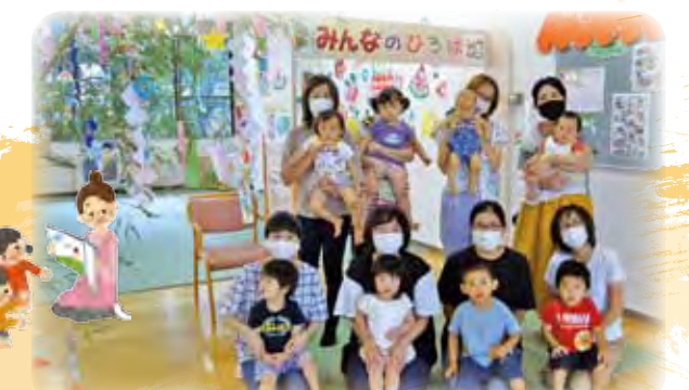
7月8日の「ハピネスタイム」 みんなで七夕さまに願いをしました。