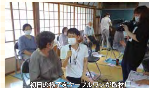
初日の様子をケーブルワンが取材!