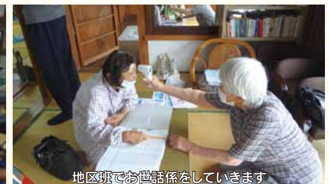
地区班でお世話係をしています