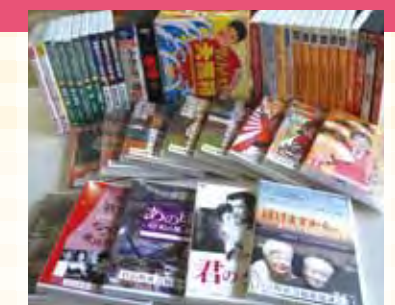
希望によってはサロンで上映会をする様子。

サロンに対し、社会福祉協議会の支援があります! ・運営費の一部を補助 ・輪投げなど皆で盛り上がる道具の貸出 ・生きがいデイの車を貸出(年2回まで)